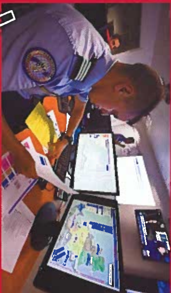
EXPERT DES QUESTIONS DE SÉCURITÉ