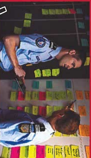
CHARGÉ DE PROJETS INNOVANTS